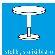
stoliki, stoliki bistro