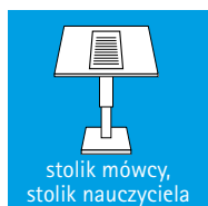
stolik mówcy, stolik nauczyciela